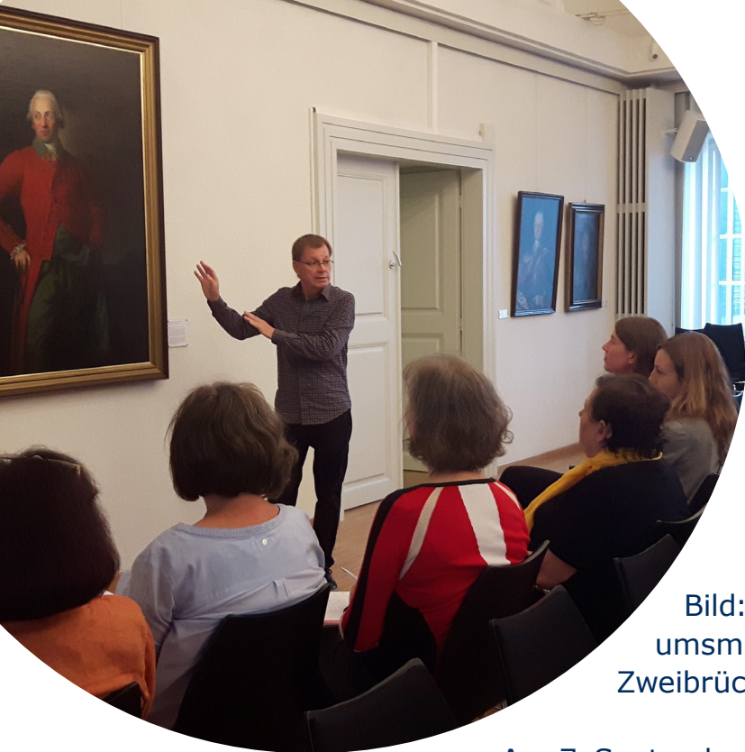
Bild: Schulungsveranstaltung mit Museumsmitarbeiterinnen und -mitarbeitern in Zweibrücken

Am 7. September fand eine Informationsveranstaltung der Landesfachstelle Demenz zum Thema „Menschen mit Demenz im Museum“ im Deutschen Zeitungsmuseum Wadgassen statt. Der Leiter der Landesfachstelle Andreas Sauder führte hier in das Thema „Menschen mit Demenz“ ein und erläuterte Formen und Symptome der Demenz und besondere Bedürfnisse von Betroffenen im Rahmen eines Museumsbesuches. Daran an schloss sich vom 14. – 16. September in Zusammenarbeit mit dem Museumsverband Rheinland-Pfalz ein dreitägiges Seminar im Stadtmuseum Zweibrücken.