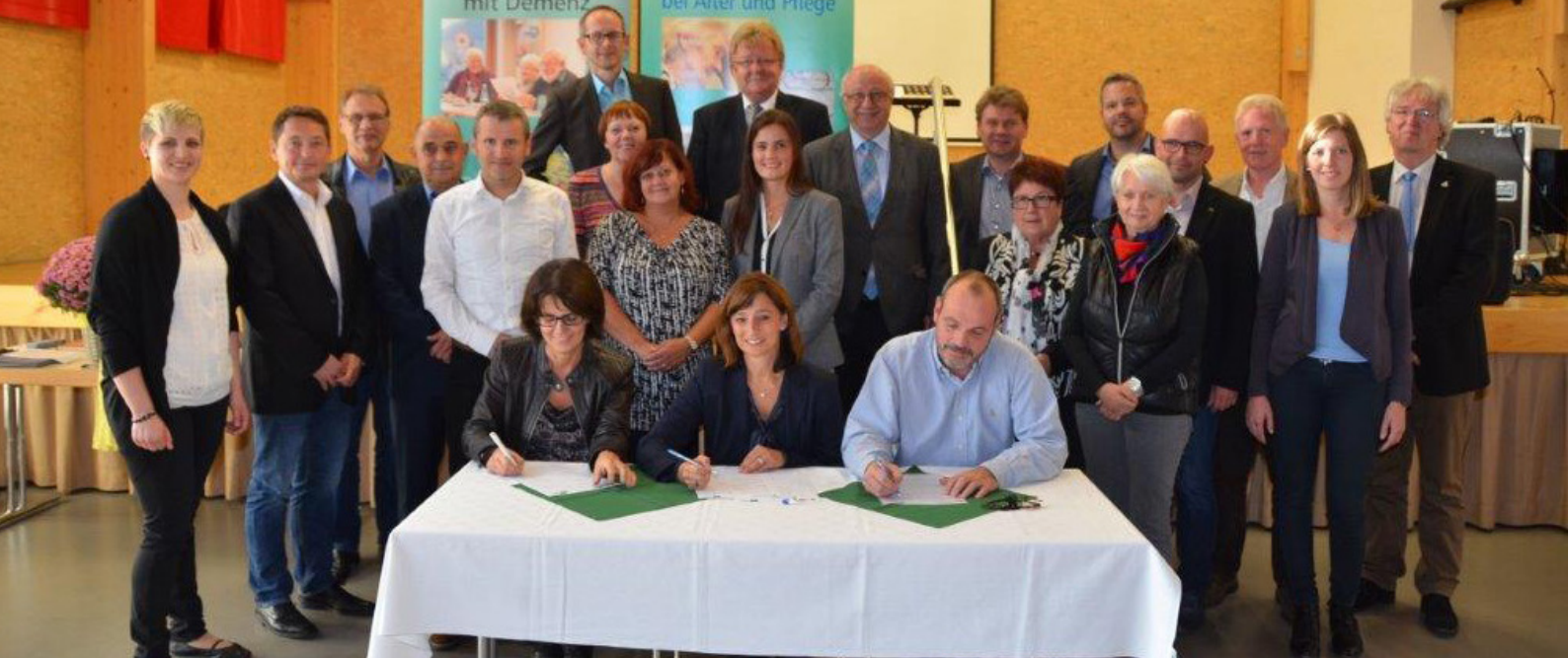
Bild: Die Kooperationspartner unterzeichneten 2015 eine gemeinsame Vereinbarung.

Flankierend zur Gründung des Netzwerks war ein weiterer wichtiger Meilenstein eine breite Öffentlichkeitsarbeit zur Sensibilisierung der Bevölkerung für das Thema Demenz. Dazu wurden regelmäßig Presseberichte veröffentlicht, eine Veranstaltungsreihe „Demenz im Kino“ wurde, entsprechend der Sozialraumorientierung, an verschiedenen Orten im Landkreis angeboten, ebenso wie demenzsensible Gottesdienste, Informationsveranstaltungen etc.