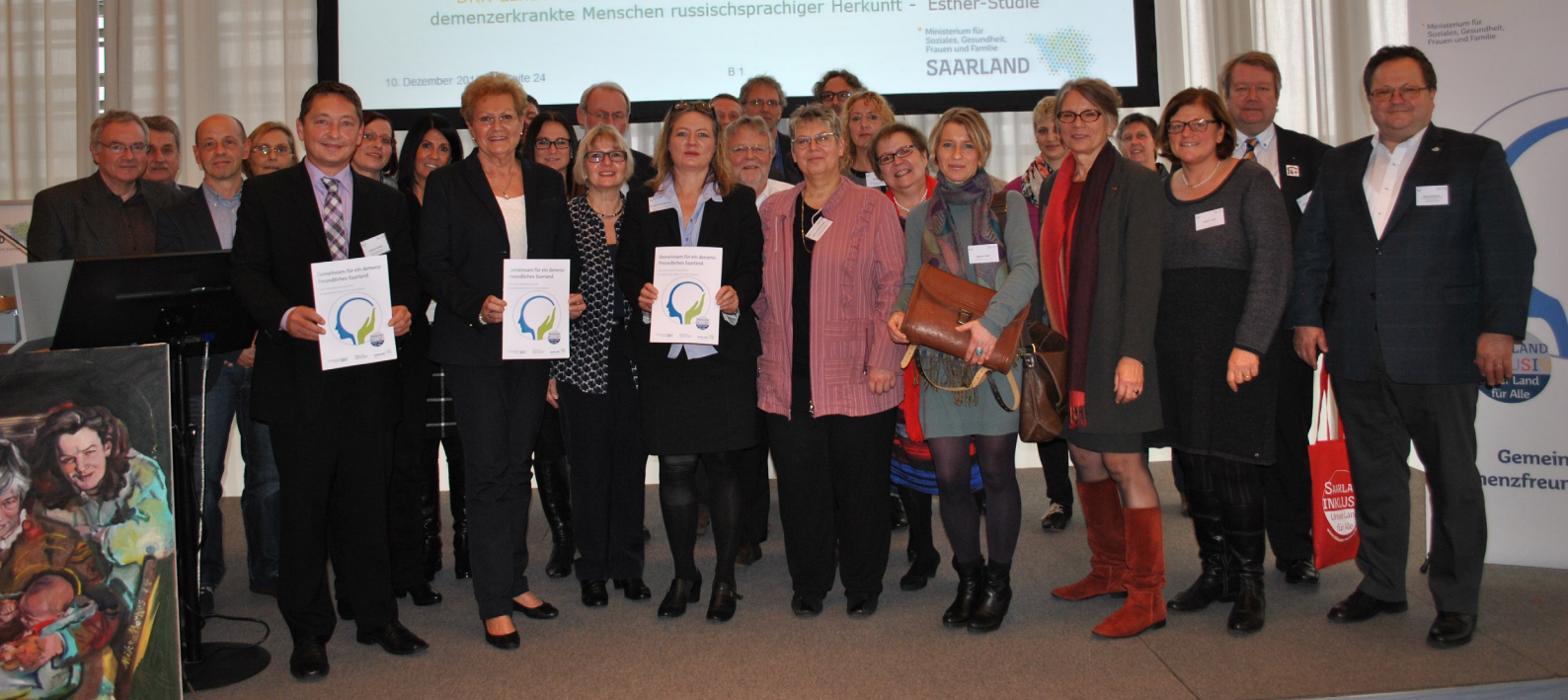
Bild: Vorstellung „Gemeinsam für ein demenzfreundliches Saarland – Erster Demenzplan des Saarlandes“ am 10. Dezember 2015

Um in all diesen und weiteren Feldern die bisherigen Beratungs- und Unterstützungsangebote zu bündeln und zielgerichtet weiterzuentwickeln, haben im vergangenen Jahr knapp 70 Kooperationspartner in der „Allianz für Demenz – Netzwerk Saar“ gemeinsam mit der Landesfachstelle Demenz und dem Ministerium für Soziales, Gesundheit, Frauen und Familie unter wissenschaftlicher Begleitung durch das iso-Institut den Ersten Demenzplan für das Saarland unter dem Titel „Gemeinsam für ein demenzfreundliches Saarland“ erarbeitet. Der Plan markierte den Startschuss für 29 konkrete Maßnahmen, die unter breiter Beteiligung sozusagen „von unten nach oben“ entwickelt wurden. Damit wurde mit einem langfristigen und offenen Prozess begonnen, an dem in den nächsten Jahren gemeinsam weiter gearbeitet wird.