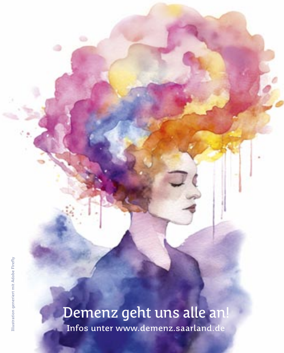
Illustration generiert mit Adobe Firefly

Ein besonderes Ereignis steht in diesem Jahr bevor: Am 17. September 2025 wird nach fünf Jahren Pause wieder eine öffentliche Veranstaltung im Theater am Ring in Saarlouis stattfinden. Unter dem Motto des Weltalzheimertages „Demenz – Mensch sein und bleiben“ soll sie die große Vielfalt der Demenzarbeit im Saarland sichtbar machen – und den vielen ehren- und hauptamtlich Engagierten eine Bühne geben.