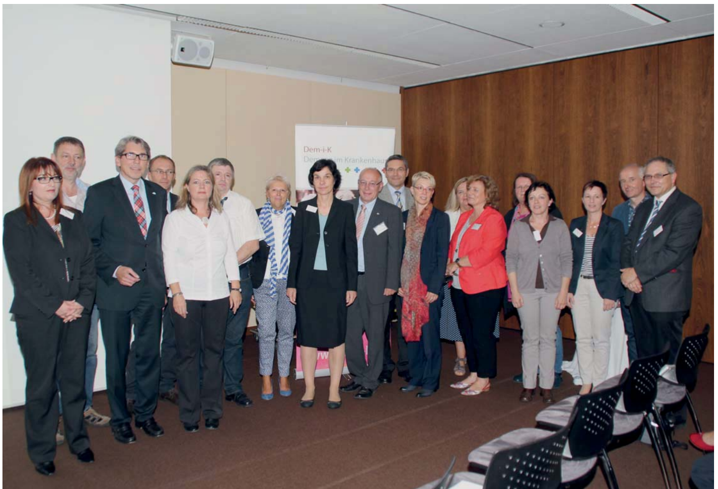
Vorstellung der Ergebnisse aus dem Projekt Dem-i-K am 19. September in Saarlouis

Anfang 2015 werden in einem Arbeitskreis mit Vertreterinnen und Vertretern aus allen saarländischen Krankenhäusern die Ergebnisse aus Dem-i-K beraten mit dem Ziel, in möglichst vielen Krankenhäusern und Fachabteilungen im Saarland demenzsensible Konzepte etablieren zu können.