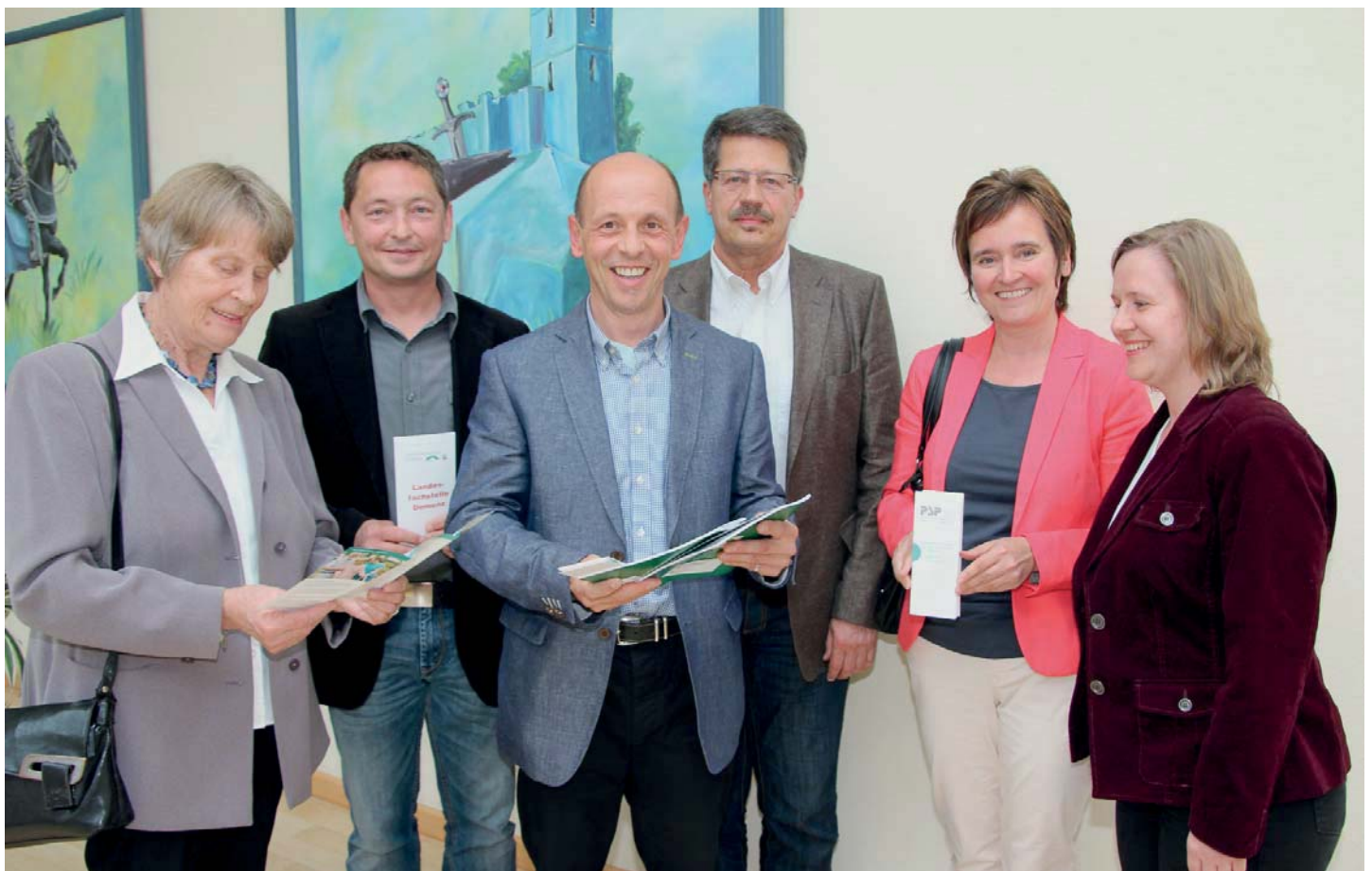
Foto: Demenzfachtagung in der Homburger Jugendherberge vom 8. Mai 2014

Am 13.09.14 hatte dann die lokale Allianz zu einer außergewöhnlichen Veranstaltung „Pfad der Sinne“ eingeladen.